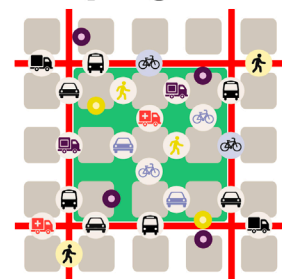
Graphik: studio LAUT auf Basis Superbe und BDN Ecologia