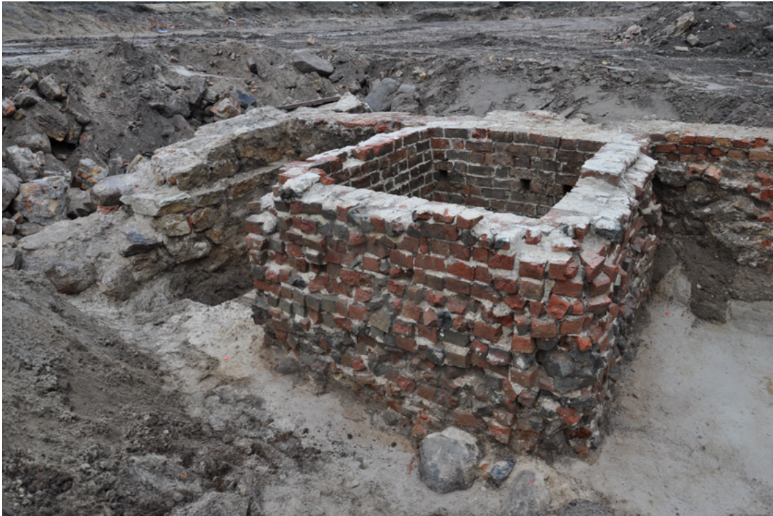
Ein Stück Stadtbaugeschichte, die Latrine aus Ziegelsteinen.