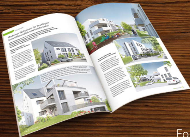
Image-Kommunikation, Mietermagazine, Geschäftsberichte, Exposés, Webmagazine

stolp+friends Immobilienmarketing seit 1989