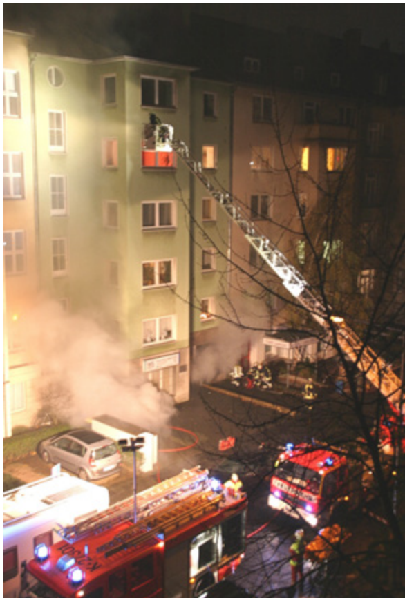
chwellbrand Wohnhaus; Foto Krolkiewicz