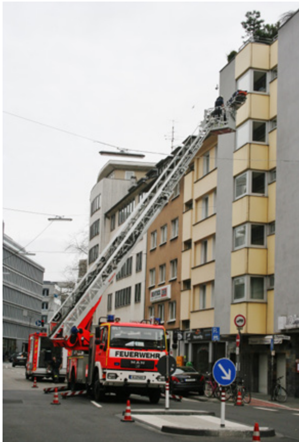
Krankenrettung Leiter

Sämtliche Landesbauordnungen (LBO), die zugehörigen Durchführungsverordnungen und Verwaltungsvorschriften unterscheiden nach