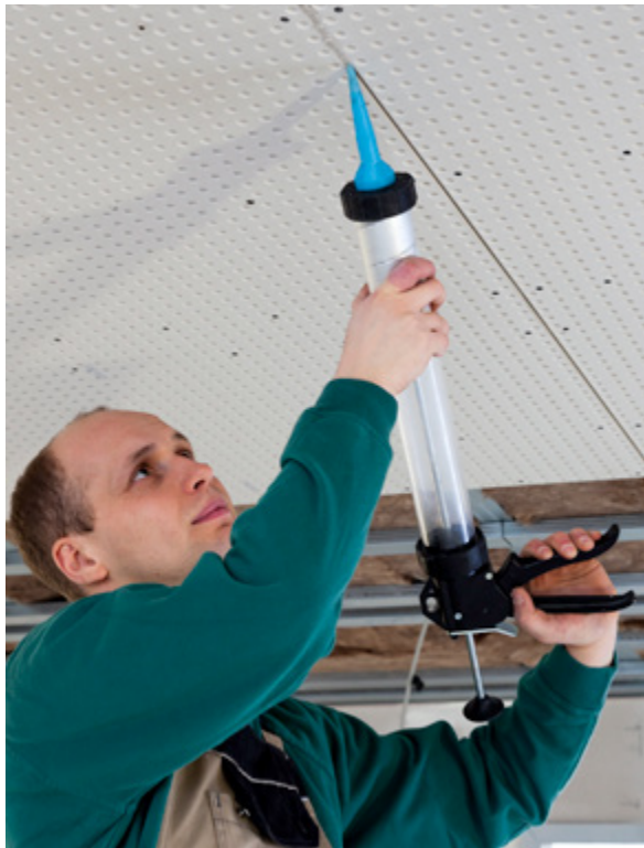
Fugen spachteln

Mit Knauf Cleaneo Rapid hat Knauf eine verarbeitungsfertige, pastöse Spachtelmasse für gelochte Akustikdecken auf den Markt gebracht. So sauber, schnell und einfach wurden Akustikdecken noch nie verspachtelt – und das ohne Fugenabzeichnungen. Die pastöse Spezialfugenmasse Knauf Cleaneo Rapid bietet die hohe Riss-sicherheit und Fugenfestigkeit, wie sie der Fachhandwerker von einer gipsgebundenen Spachtelmasse wie etwa Knauf Uniflott gewohnt ist. Sie wurde entwickelt zum Verspachteln von gelochten Gipsplatten mit Schnittkante oder Falzfuge wie zum Beispiel Knauf Cleaneo Akustik FF.