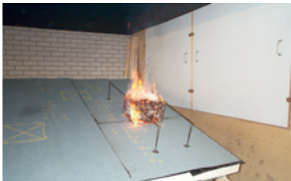
Prüfkorb Brandlast

ebenfalls im § 32 der MBO. Grundsätzlich ist bei allen Planungen ist die Bauordnung des jeweiligen Bundeslandes zu berücksichtigen, da es bei den vielfältigen Themen rund um den Brandschutz Abweichungen und Besonderheiten geben kann.